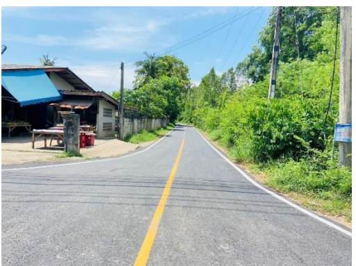
สายซอยห้วยตาเซาะ (ชุมชนบ้านช่องพราน)