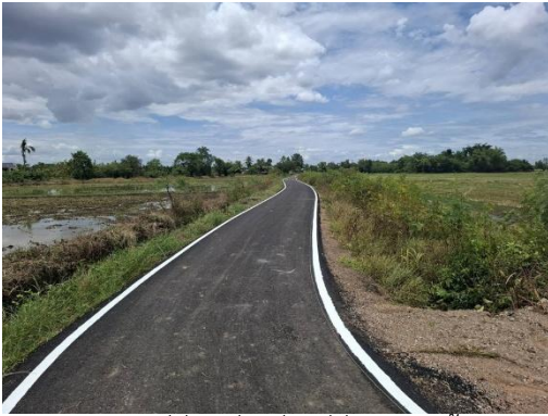
บริเวณถนนสายหมู่ที่ 1 เชื่อมต่อหมู่ที่ 7 ชุมชนบ้านเขาดิน