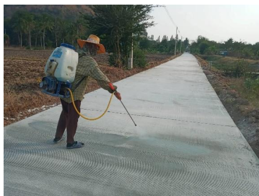
สายฟาร์มมา-วัดถ้ำน้ำ (ชุมชนบ้านห้วยตาบุญจันทร์)