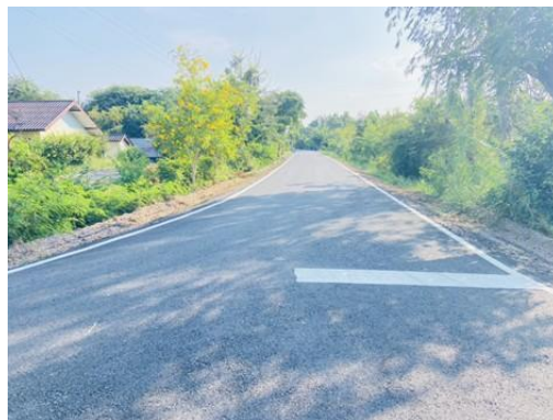
สายคลองชลประทาน-อู่ช่างหนุ่ม (ชุมชนบ้านขุยจาม)