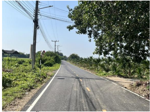
ถนนสายหน้าโรงเรียนวัดโคกทอง-สุดเขตเทศบาล