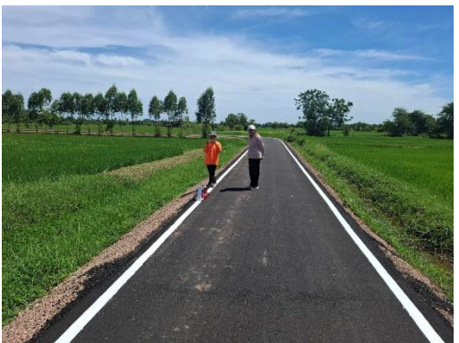
ถนนสายบ้านลุงตา แดงออน (ชุมชนบ้านนางแก้ว)